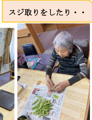
スジ取りをしたり・・・