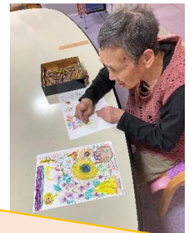
好きな塗り絵をしたり・・・