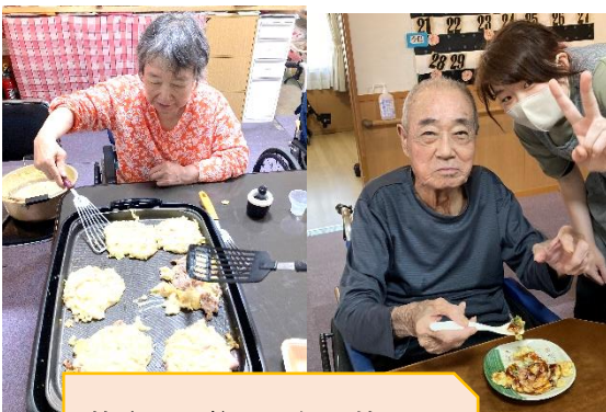
皆さんの為にお好み焼きを焼いて下さったり・・・